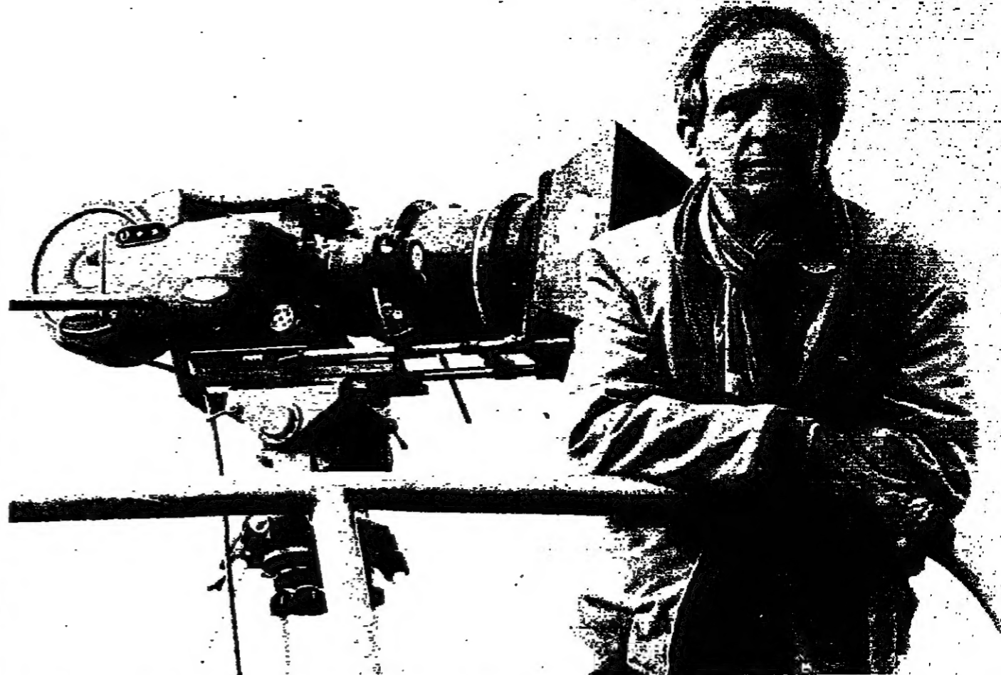
● في ٢١ تشرين الاول فقدت السينما الفرنسية احد ابرز مخرجيها فرانسوا تريفنو رائد الموجة الجديدة في السينما